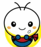
米原市シンボルキャラクター ほたるん

長浜市役所 健康推進課 TEL:0749-65-7759 FAX:0749-65-1711 平日 午前9時から午後4時45分まで