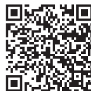
Website de Maibra

(Se caso a criança for ingressar na escola primária em 2023) Clubes infantis que a crinaça frequenta