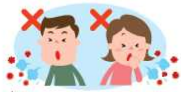
(左) 不做任何措施时 打喷嚏 咳嗽 (右) 用手来盖住时