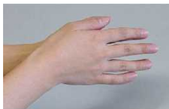
① 用肥皂，自己搓洗手心

从外地回家的时候，在烹饪前后和吃饭前，要勤用肥皂洗手。 指甲剪短，把手表和戒指取下来后洗手。