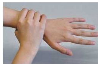
⑥ 不要忘记清洗手腕