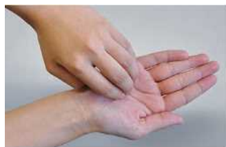
③ 指尖及指甲间要仔细清洗