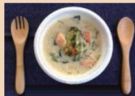
琵琶三文鱼的奶油汤