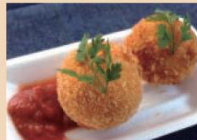
琵琶三文鱼 奶油芝士土豆饼