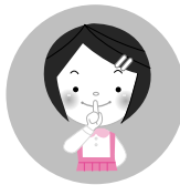
大声で 会話をしない