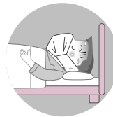
体調不良時は 来場を控える