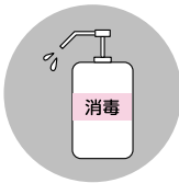
受け付け時の 検温、消毒