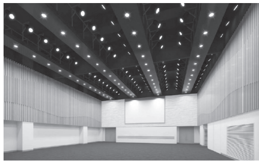
▲コンベンションホールには約300人が収容可能(イメージ図)

複合機能(交流エリア)として、シンポジウム等が開催可能なコンベンションホールや、サークル活動等に利用可能な会