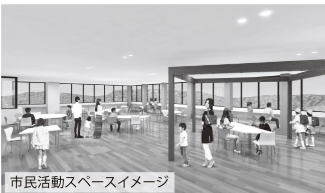
市民活動スペースイメージ