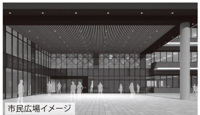
市民広場イメージ