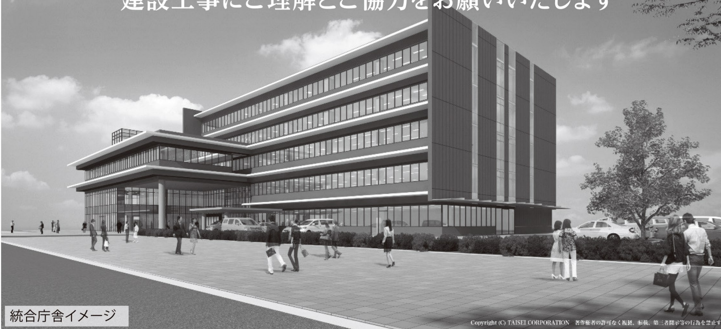
統合庁舎イメージ

Copyright (C) TAISEI CORPORATION 著作権者の許可なく複製、転載、第三者開示等の行為を禁止す