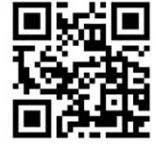
▲マイナポータルはこちら

国において、令和6年12月2日以降従来の被保険者証は新たに発行しないこととされ、マイナ保険証 ※1 を基本とした受診に変更となったことから、本市国民健康保険に加入されている方に、下記の区分に応じて、8月1日から使用いただく「資格確認書」または「資格情報のお知らせ ※2 」をお届けします。交付対象の方には、7月中旬～下旬にご自宅にお届けしますので、内容に誤り等がないか確認してください。