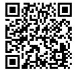
▲取扱業務など 詳しくはこちら (市公式ウェブサイト)