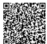
申込方法など 詳しくはこちら (市公式ウェブサイト)▶