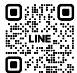
▲市LINE公式 アカウントはこちら

※天候不良等により運行をとりやめる場合は、事前に防災アプリや市LINE公式アカウントでお知らせします。 ※毎月の運行カレンダーや地域の配置場所は、市LINE公式アカウントでお知らせします。