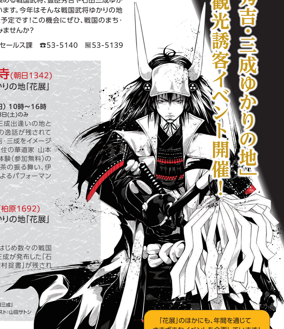
「石田三成」イラスト:山田サトシ

「花展」のほかにも、年間を通じてさまざまなイベントを企画しています!皆さまのご参加をお待ちしています!