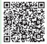
▲健康診査・がん検診ガイド