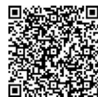
▲市公式ウェブサイト