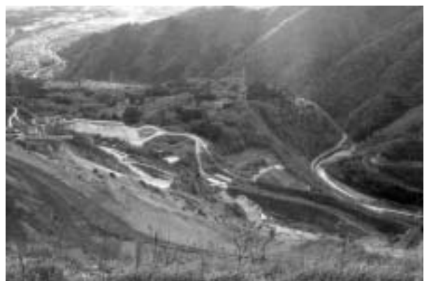
▲姉川に張り出した台地全体を山から遮断するように構築されているシン垣

現在は、県道が整備されたため地元でも峠を通る人は少なくなり、若い世代の中にはシン垣のことを知らない人もいます。今回の文化財指定が地域の魅力の再発見となり、新たなまちづくりにつながってほしいと思っています。